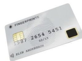
Ett antal samarbeten och marknadstester inom biometriska smarta kort lanserades under kvartalet.

Ett antal samarbeten och marknadstester inom biometriska smarta kort lanserades. I oktober offentliggjorde Soci t  G n rale Frankrikes f rsta test av biometriska betalkort i samarbete med IDEMIA. Kortet baseras p  IDEMIA:s F.CODE-teknik, som inneh ller Fingerprints T-Shape-modul. Och i november lanserade Intesa Sanpaolo Italiens f rsta test av biometriska kort. Kortet tillhandah lls av Gemalto med teknik fr n Zwipe och anv nder en sensor fr n Fingerprints FPC1300-serie. I november meddelade också Fingerprints partner Zwipe att bolaget testar kontaktl sa biometriska betalkort med tio banker p  olika st llen i Mellan stern.  ven dessa kort anv nder sensorer fr n Fingerprints FPC1300-serie.